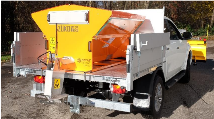
Trägerfahrzeug Mitsubishi L200