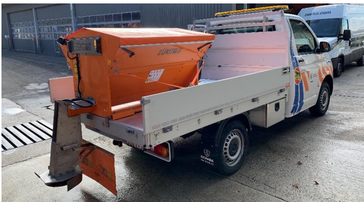
Trägerfahrzeug VW T6