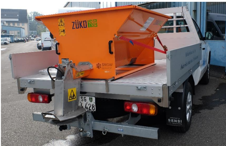
Trägerfahrzeug VW Amarok