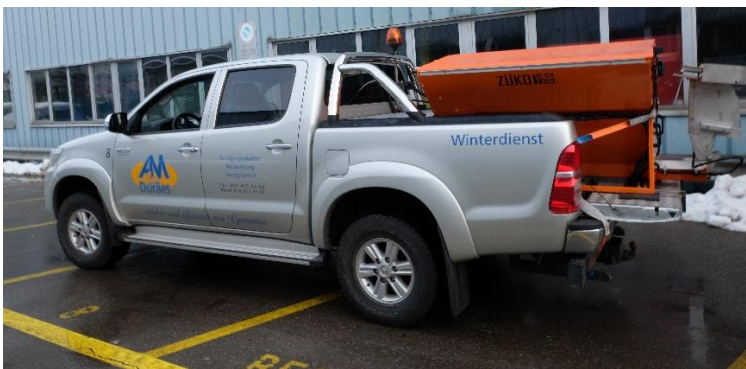
Trägerfahrzeug Toyota Hilux