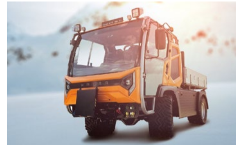
HANSA XL : nouveau modèle XL de Hansa, constructeur de machines et pour la première fois en Suisse doté d'un nouveau design concernant la cabine !