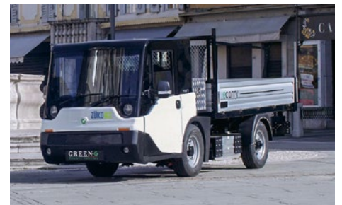
Green-G ecarry petite camionnette électrique