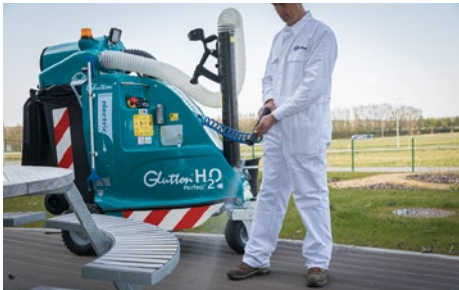
Glutton H 2 O Perfect : aspirateur électrique de déchets avec nettoyeur à moyenne pression – un jet d'eau et c'est déjà propre !

Nous exposerons, entre autres, les appareils suivants à la Suisse Public :