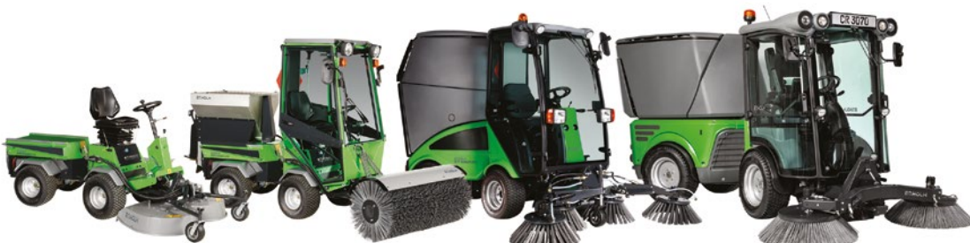
Egholm. Une palette de produits Park Ranger 2150 à City Ranger 3070, multifonctionnel doté de Quick Shift – c'est Egholm !