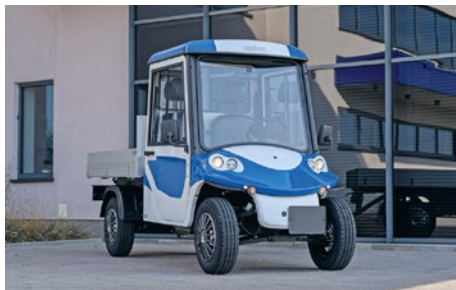
Melex 390 : un modèle parmi tant d'autres de la famille Melex, nouvellement présenté en Suisse par Züko AG !