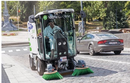
Glutton Zen : balayeuse complètement électrique pour rendre à l'avenir une propreté Zen à votre cité !