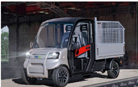
Züko Utility N50 : notre nouveau fleuron parmi les fourgonnettes électriques – design, fonctionnalité et fiabilité !