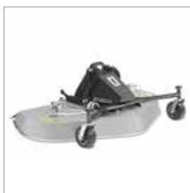
■ Heckauswurf-/ Mulchmäherwerk 1500