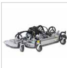
■ Triplex Heckauswurfmäherwerk 2500