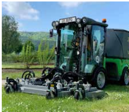
Triplex Heckauswurfmäherwerk 2500