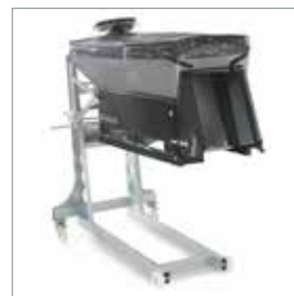
□ Salz- und Kiesstreuer