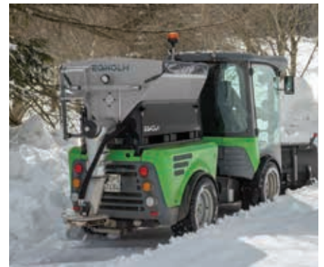
Salz- und Kiesstreuer