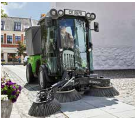
Kehrmaschine mit 3. Besen