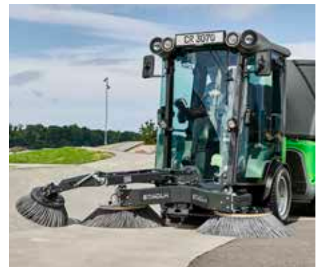
Kehrmaschine mit 3. Besen