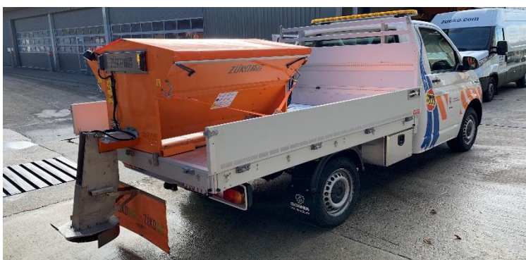
véhicule porteur VW T6