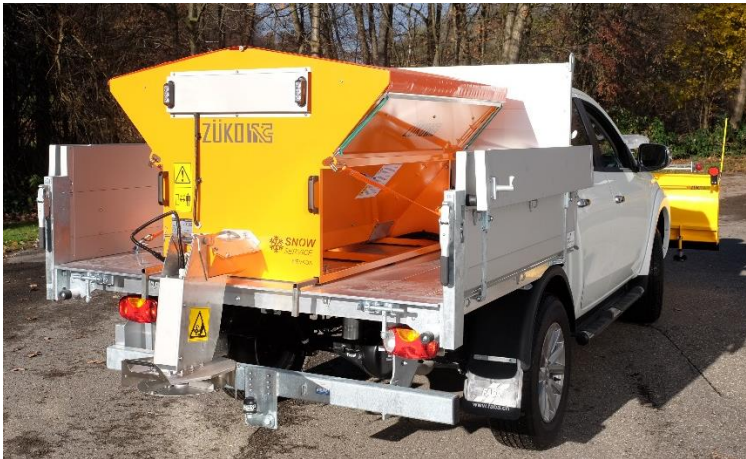
véhicule porteur Mitsubishi L200