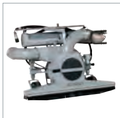
Aspirateur de feuilles