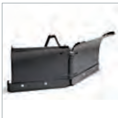
Lame chasse-neige en V