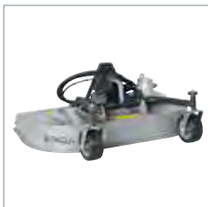
Tondeuse rotative, mulching ou collecteur d'herbe 1000