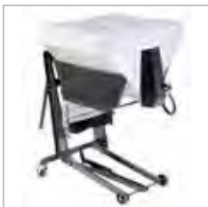
Épandeur de sel et de sable