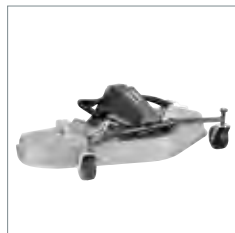
Tondeuse rotative ou mulching 1500