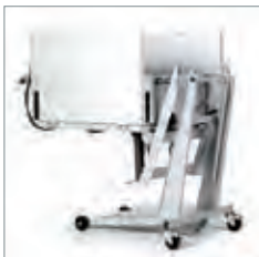
Porte-charge avec fonction de bascule