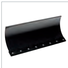
Lame à neige