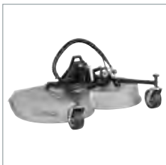
Tondeuse rotative ou mulching 1200