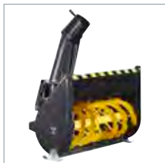
Fraise à neige