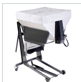
□ Épandeur de sel et de sable

Egholm A/S - Les spécifications et les détails sont susceptibles d'être modifiés sans préavis. Des illustrations peuvent être fournies avec l'équipement supplémentaire.