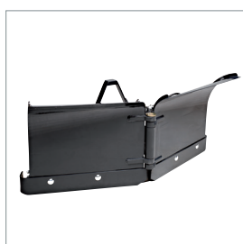
□ Lame chasse-neige en V