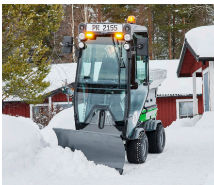
Lame à neige