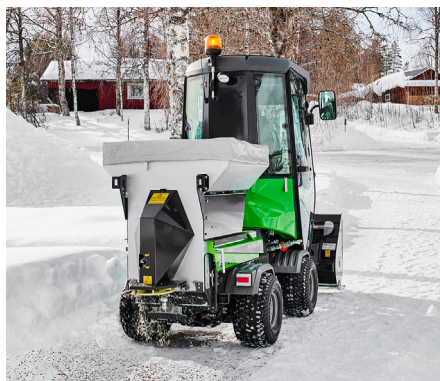
Épandeur de sel et de sable