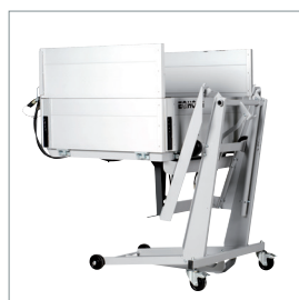
■ Porte-charge avec fonction de bascule