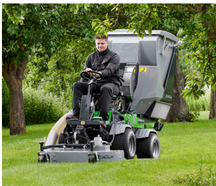
Tondeuse rotative/mulching 1000 avec collecteur d'herbe