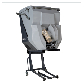
■ Collecteur d'herbe