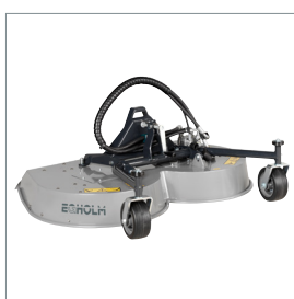
■ Tondeuse rotative ou mulching 1200