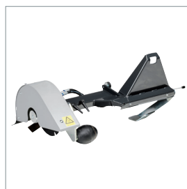
■ Coupe bordures