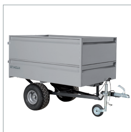
■ Remorque basculante