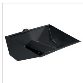
■ Chargeur frontal