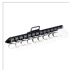
■ Râteau écologique