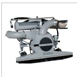
■ Aspirateur de feuilles