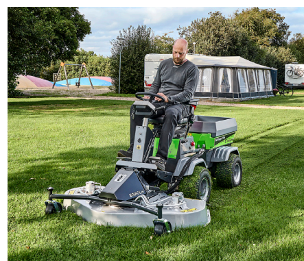
Tondeuse rotative/mulching 1500