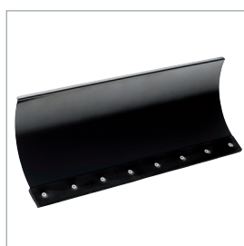
□ Lame à neige