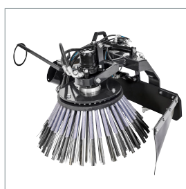
■ Brosse de désherbage