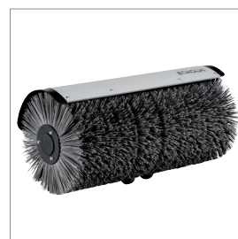
□ Balai rotatif