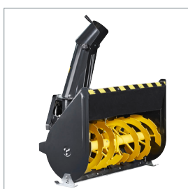
□ Fraise à neige