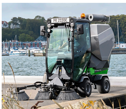
Balayeuse aspiratrice avec 3ème balai