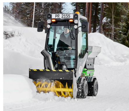
Fraise à neige