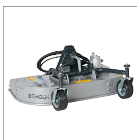
■ Tondeuse rotative, mulching ou collecteur d'herbe 1000