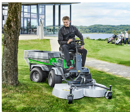
Tondeuse rotative/mulching 1200